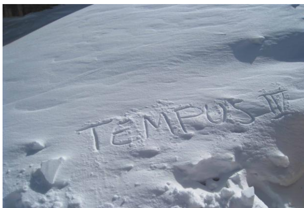
Фотография сделана членами консорциума проекта «Магистратура "Взаимодействие/ Безопасность/ Сертификация" в области Международного Железнодорожного транспорта в Казахской Академии транспорта и коммуникаций

В Казахстане программа действует с 1995 года. В общей сложности за прошедший период профинансировано 59 проектов, в том числе 23 национальных и 36 региональных. Из них 44 совместных европейских проекта, 15 структурных и дополнительных мероприятий.